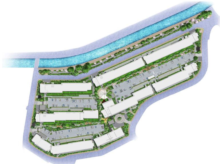
全8棟がすべて南方位に向けた住棟計画