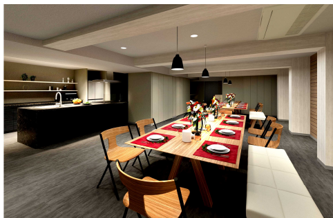
パーティールーム