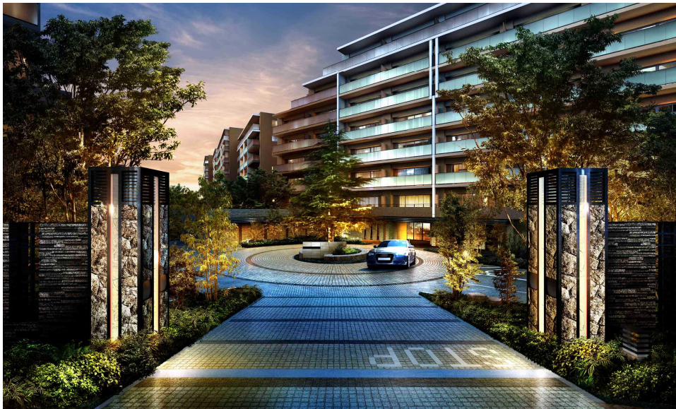
「Brillia City 石神井公園 ATLAS」の外観(一部)と車寄せイメージ

なお、本物件モデルルームでは、本物件ご契約者と地域の皆様との早期コミュニティ形成を図るため、地域交流拠点「Shakuji-ii BASE（シャクジイベース）」を併設しています。地域の皆様の憩いの場、旧団地住民の皆様のサークル活動の場などにご利用できるようレンタルスペースとしての運用も開始するとともに、様々なイベント開催を通じて地域の皆様の交流を促進いたします。