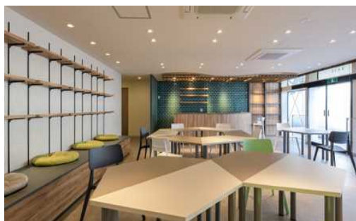
「シャクジイベース」内部

運営会社：非営利型株式会社 Polaris https://polaris-npc.com/