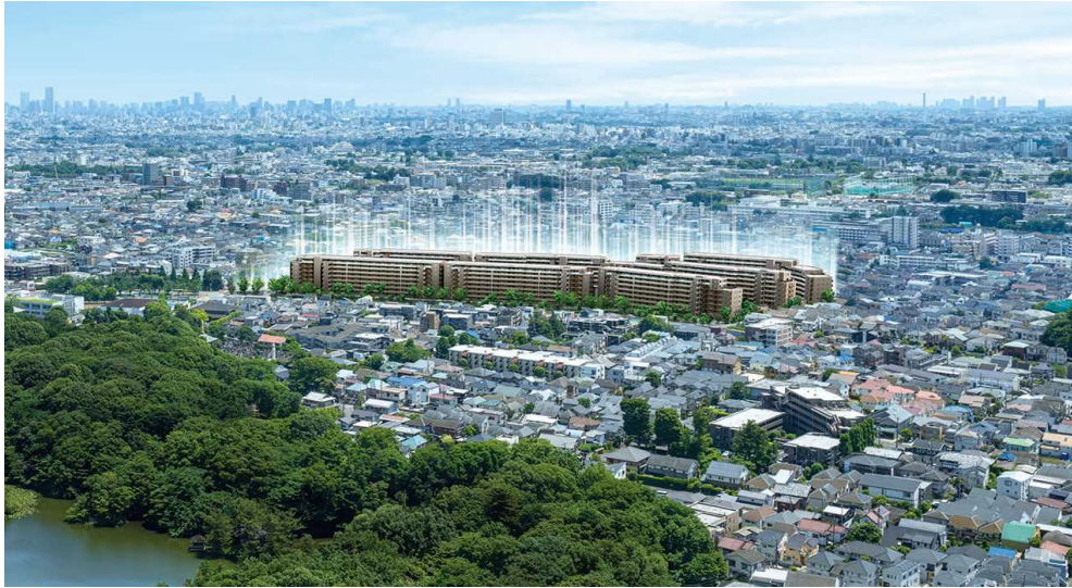
「都立石神井公園」(上空)側から「Brillia City 石神井公園 ATLAS」を望むイメージ